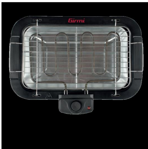
GRĂȚAR ELECTRIC CU GRILL BARBEQUE BQ11